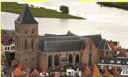
O.L. Vrouwe- of Buitenkerk (R.K.) Kampen