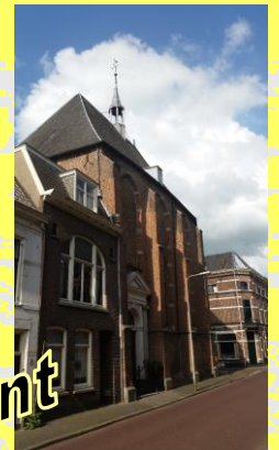
St. Annakapel Kampen